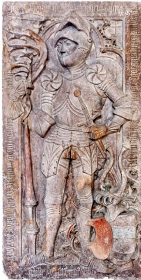
Der Grabstein des Ritters Virgil von Graben († 1507) befindet sich in der Benefiziat-Kirche St. Michael am Lienzener Rindermarkt. Virgil, ein Vertrauter Graf Leonhards von Görz, wickelte nach dessen Tod die Übergabe der Grafschaft Görz an König Maximilian I. ab.

Innichen oder dem Bischof von Freising grundherrschaftlich unterworfen.