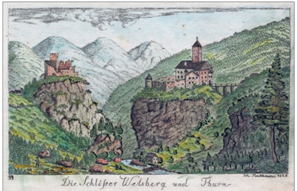
Die kolorierte Radierung von Johann Tinkhauser aus dem Jahr 1828 zeigt die Burgen Welsperg (rechts) und Turn in Welsperg, die beide den späteren Grafen von Welsperg gehörten.

Wie dem Steueranschlagbuch von 1574, das die nichtadeligen Güldenbezieher als „Singularpersonen“ nach Gerichten einzeln verzeichnet, zu entnehmen ist, war ihre Zahl zum Teil beachtlich, besonders im westlichen Pustertal: im Stadtgericht Lienz 16, im Landgericht Lienz 8, im Gericht Virgen