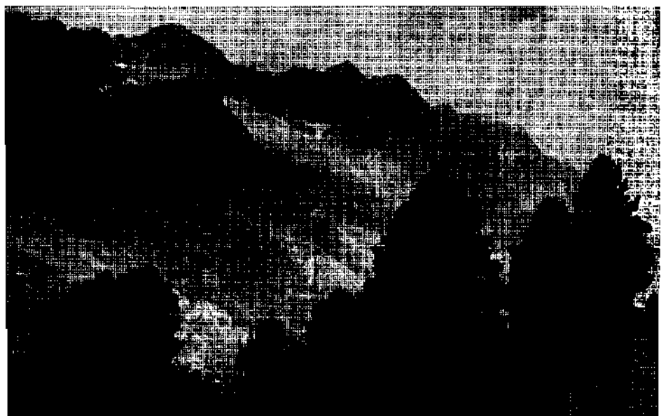
Zirbenwald im Trojer-Almtal/Def.

Nach einer viele Jahrtausende währenden nacheiszeitlichen Entwicklung der Böden,