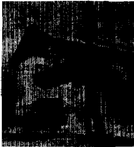
Wohnhaus des Gelehrten in Patriasdorf

Sein Eigenheim in der Pfarrgasse in Lienz bezog er 1955 und verstand es dabei, das „Institut im eigenen Haus“ einzurichten, wo er sich nun fast unbeschwert von Bürokratie und praktisch unabhängig seinen großen wissenschaftlichen Arbeiten widmen konnte. Dabei standen ihm 2 Mitarbeiter zu und zur Seite, die sich (z. B. C. v. Demelt oder C. Holzschuh) zu anerkannten Entomologen entwickelten. Dienstlich war er aber immer wieder mit der Bekämpfung von Forstschädlingen in Kärnten, Osttirol und im Rahmen einer Sondervereinbarung auch im Südtirol tätig. Mit 1. 1. 1964 mußte er nach Erreichen der Altersgrenze in den Ruhestand treten, obwohl er sich bester Gesundheit und Schaffenskraft erfreute. Leider war damit auch der Entzug seiner Hilfskräfte verbunden, was er bis heute